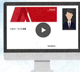
■ ウェビナーのイメージ